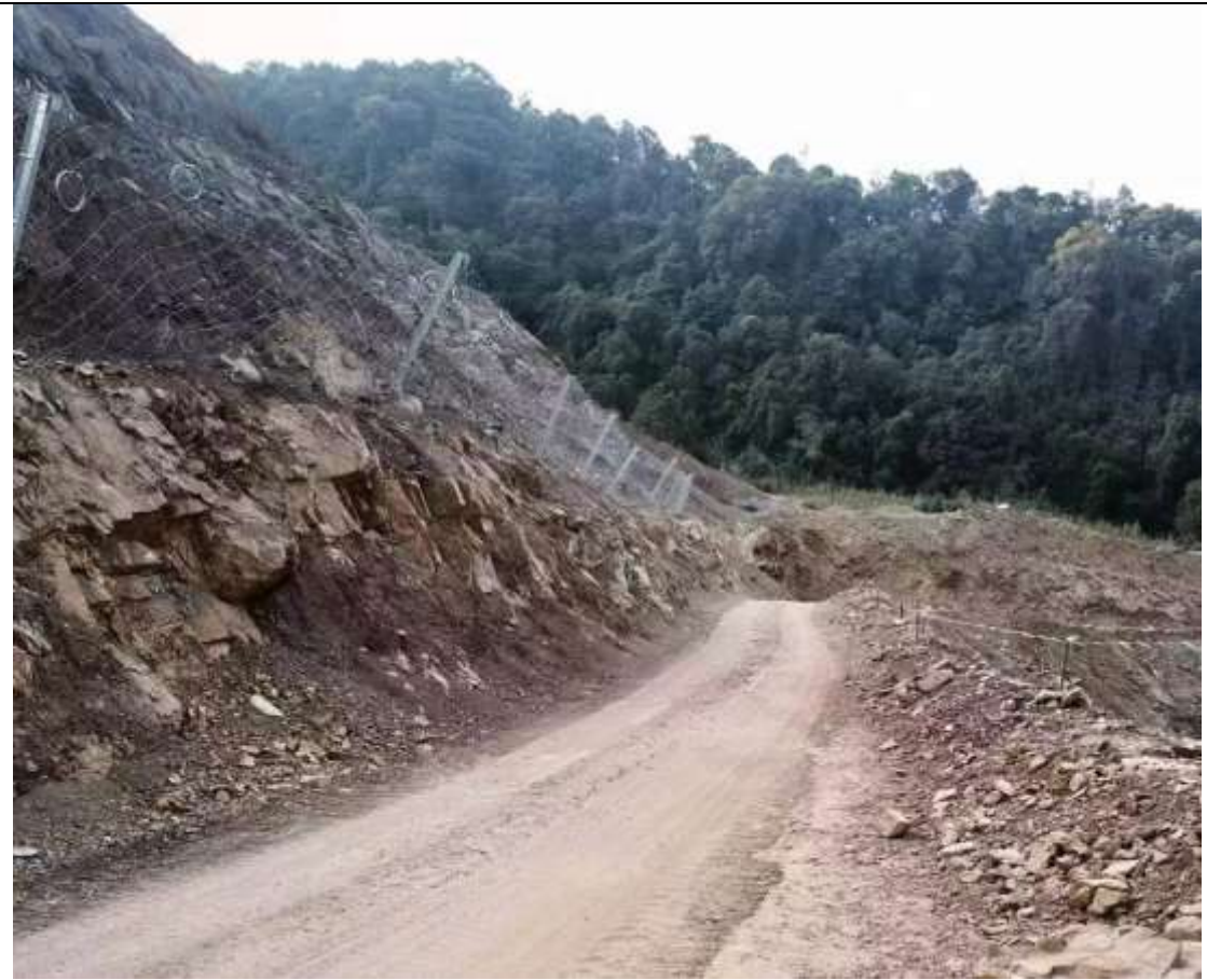
一采区隐患治理工程下部矿山开拓运输道路