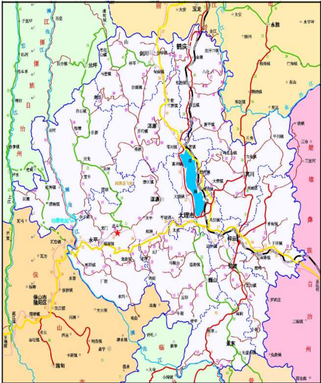
图 2.1-1 交通位置图