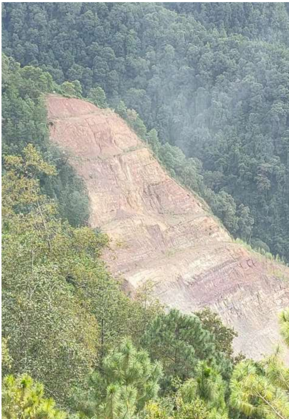
图 2.4-1 原一采区现状