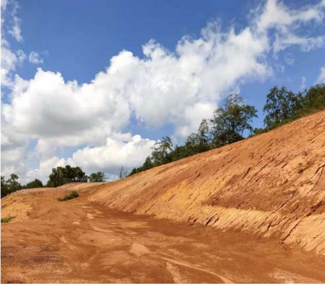
图 2.4-2 原二采区现状