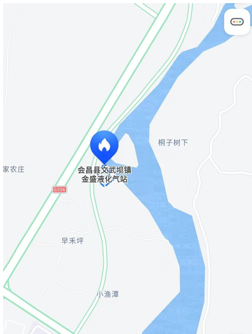
图 2-1 企业地理位置图

会昌县位于江西省赣州市东南部，武夷山余脉西麓，南岭余脉北端，赣江一级支流贡江上游，东南邻福建武平和长汀，南接寻乌，西南毗安远，西北连于都，东北交瑞金。为赣、闽、粤“三省通衢”之地。辖区面积 2709.91 平方千米。